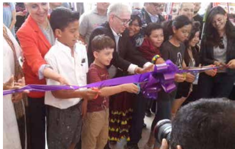
Entre decenas de niños y jóvenes fue cortado el listón de inauguración.