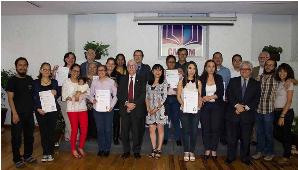
Algunos de los alumnos e instructores de la 13ª generación del diplomado Los procesos en la edición de libros.

Asimismo, agrego que “para la Cámara es una gran satisfacción anunciar que, a partir de la próxima generación, el Centro de innovación y formación profesional para la industria editorial,