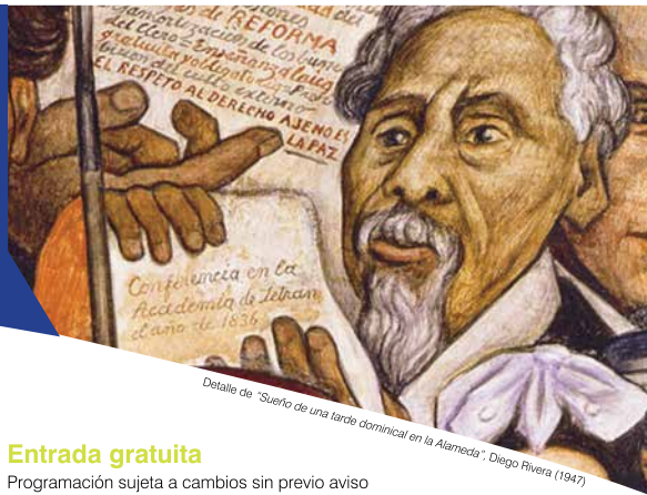
Detalle de "Sueño de una tarde dominical en la Alameda", Diego Rivera (1947)